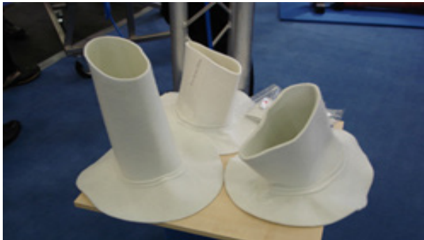
Bilde 4. Varianter av "hatter".