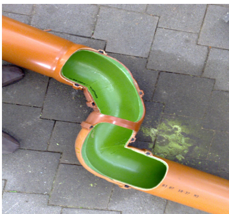
Bilde 2. Fleksibilitet ved avvinkling.